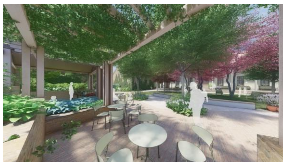
Rozvoj nádvorja "Zeleného domu" vo Vyšehrade pre cestovný ruch