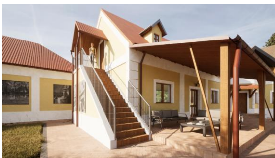
Rozvoj Sacherovho domu pre cestovný ruch v Želiezovciach