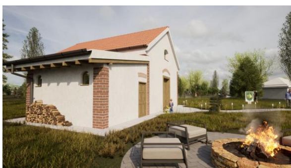
Obnova a turistické využitie budovy mlyna Zalaba

Výzva bude založená na dvojkolovom hodnotení, pričom rozhodnutie o akčných plánoch sa očakáva v lete 2025.