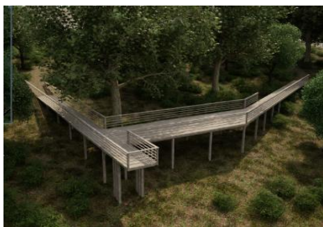
Vytvorenie rekreačného chodníka v Törökmező