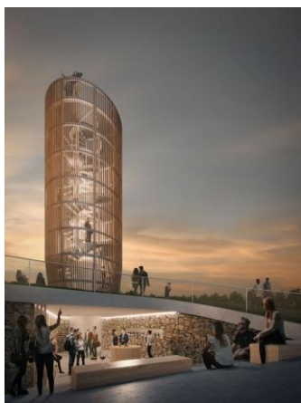
Zriadenie centra pre návštevníkov vinárstva v Strekove