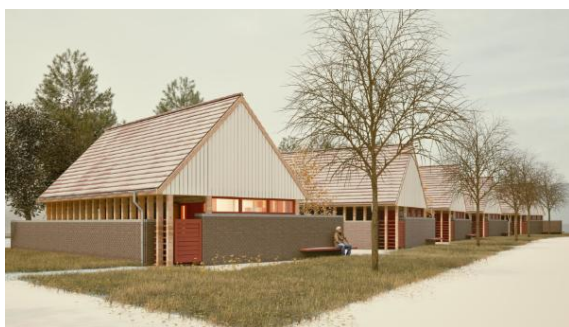
Vývoj ubytovania v obci Verőce

Vizuálny plán niektorých plánovaných projektov: