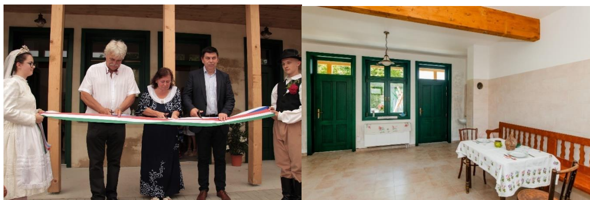
Slávnostné odovzdanie v Salke

Celkové náklady na projektovú časť (vrátane výstavby, nákupu zariadení a iných súvisiacich služieb) sú 487 426 EUR.