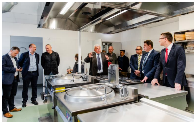
Slávnostné odovzdanie sociálnej kuchyne v obci Bernecebaráti

Ďalší projekt akčného plánu RE-START s názvom RE-STRUCTURE spomínaný vyššie, je zameraný na rekonštrukciu objektov, ktoré poskytnú priestory pre sociálnu kuchyňu v obci Bernecebaráti a práčovňu v obci Kemence, oba tieto projekty sú navzájom úzko prepojené. Z projektu RE-NEWAL zabezpečili kompletne vybavenie potrebné pre poskytovanie zmieňovaných služieb.