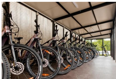
Vzdelávacie centrum v obci Ipolydamásd

Okrem priestorov vhodných na interiérovú rekreáciu pribudli aj investície podporujúce vonkajšie aktivity. Dunakanyar-Ipoly-Börzsöny nezisková spoločnosť pre územný rozvoj s ručením obmedzeným zastreší systém elektrobicyklov, a v rámci projektu zakúpili celkovo 21 kusov. Na úschovu požičovní bicyklov je zriadená aj zabezpečená úschovňa bicyklov. V blízkosti budovy sa nachádzajú aj vonkajšie cvičebné zariadenia vhodné na cvičenie pre seniorov.