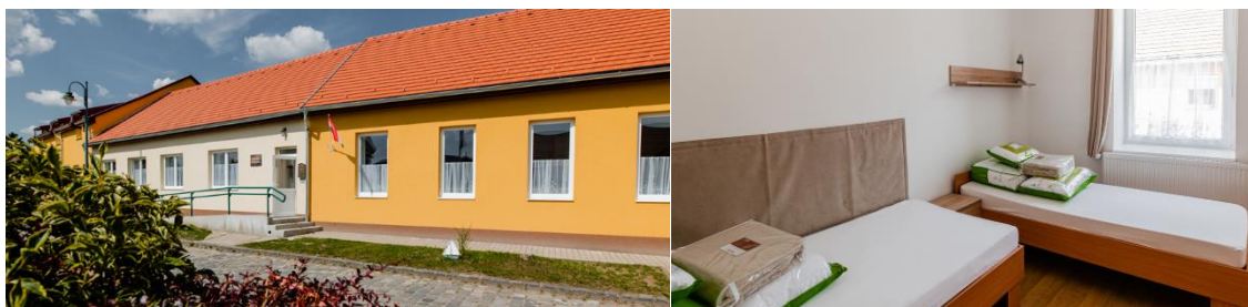
Sociálne zariadenie v obci Szob

Sociálne zariadenie Védőszárny v obci Szob poskytuje primerané ubytovanie a starostlivosť pre 32 starších ľudí. Inštitúcia poskytne primerané ubytovanie a starostlivosť pre 32 seniorov. Na ploche takmer 500 m 2 bude vytvorená jedna štvorposteľová, šesť trojposteľových a päť dvojposteľových izieb a v rámci projektu bolo zakúpené aj potrebné vybavenie. Vďaka tejto investícii vznikol 11 nových pracovných miest. Doterajšie zariadenie pre seniorov v Szobe zostane v prevádzke aj naďalej, mesto tak spolu s novými kapacitami bude mať k dispozícii pre seniorov celkom 50 ubytovacích miest. Celkové náklady na projektovú časť (vrátane výstavby, nákupu zariadení a ďalších súvisiacich služieb) sú 872 160,38 EUR.