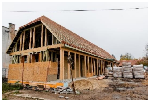
Remeselný dom vo výstavbe