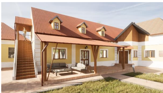
Podkrovná inštalácia - Želiezovce