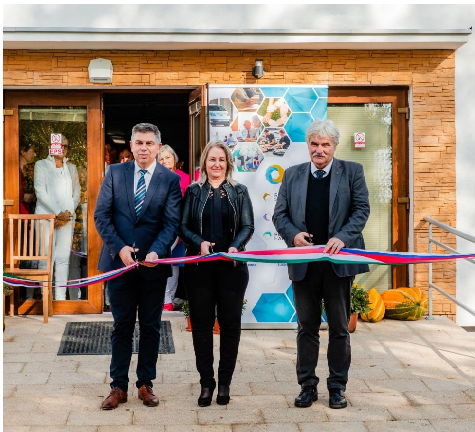
Odovzdanie sociálneho zariadenia v Salke

Obnova zariadenia sociálnych služieb pre seniorov v Szobe bola v roku 2021 ukončená, v súčasnosti prebieha jeho zariadenie. Budúca inštitúcia poskytne primerané ubytovanie a starostlivosť pre 32 seniorov. Na ploche takmer 500 m 2 bude vytvorená jedna štvorposteľová, šesť trojposteľových a päť dvojposteľových izieb.