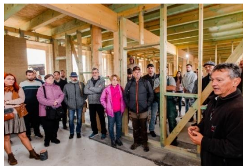
Konopný betón - deň otvorených dverí

Za uplynulých dvadsať rokov sa tu uskutočnili tábory pre viac ako jedenásttisíc detí, a tak pomaly prerástli existujúcu budovu. O starodávne remeslá je čoraz väčší záujem, preto sa ľudový dom rozširuje o remeselnícky dom, ktorý poskytne priestor aj na podujatia pre seniorov.