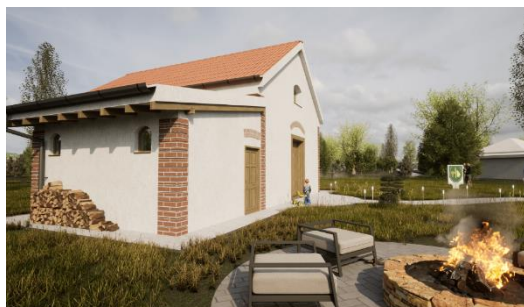
Mlyn - Zalaba