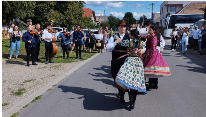
Podujatia CSEMADOK - odovzdávanie vedomostí mladým ľuďom, zachovávanie tradície