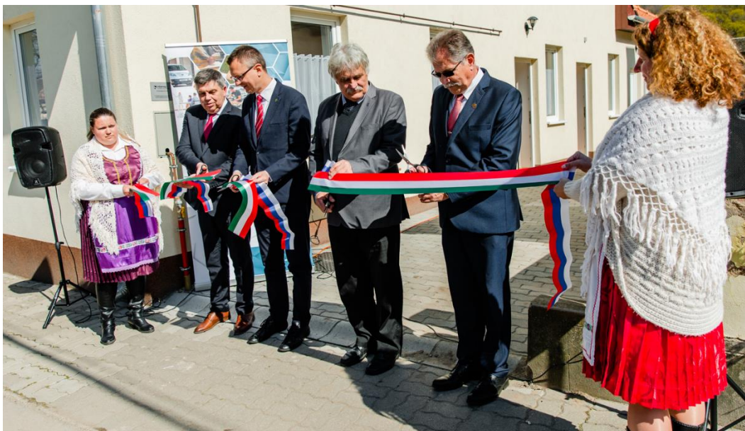
Odovzdanie budovy práčovne Kemence

Práčovňa vybudovaná v obci Kemence prevezme na seba čistiace služby oblastných sociálnych inštitúcií a zariadení pre seniorov. Okrem vybavenia práčovne bude zakúpené aj auto usposobené na prevoz znečistenej a čistej postelnej bielizne a iných textílií na príslušné miesto.