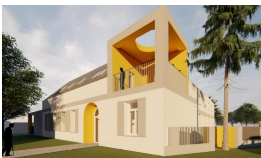
Ipeľské múzeum a vodno-turistický centrum

V činnosti prípravy projektov sme pokračovali aj v roku 2022. Z dotácie Ministerstva zahraničných vecí a zahraničného obchodu v tomto roku - sústreďujúc sa na pripravovaný turistický akčný plán, na báze znaleckého hodnotenia a turistickú zakladajúcu štúdiu uvedenú v predchádzajúcej kapitole - pre slovenskú obec Ipeľské Úľany sme pripravili projektové návrhy pre opätovné využitie školy v prírode a turistického ubytovania, pre obec Zalaba pre opätovné využitie budovy mlynu, a pre zužitkovanie podkrovia Domu Sacher v Želiezovciach sme pripravili projekty pre povoľovanie. Na maďarskej strane v obci Kóspallag sme naplánovali rekonštrukciu pamätného miesta mlynu, spoločensko-kultúrny priestor a rozhľadňu, a v obci Ipolytölgyes sme vyhotovili návrhy budovy Ipeľského múzea a vodno-turistického centra: