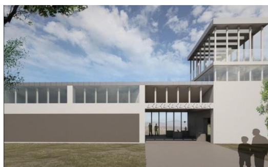
Spoločensko-kultúrny priestor v obci Kóspallag