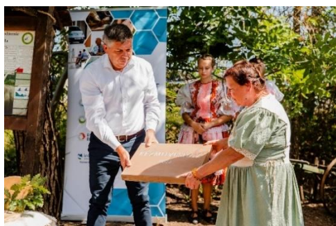
Položenie základného kameňa

Ipeľské Kultúrne a turistické združenie má v pláne rozšíriť Dom ľudových tradícií o nový objekt, v ktorom budú predstavené ďalšie remeselné funkcie.